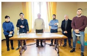
La presentazione del progetto